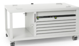
Recirculador Chiller F-325

“Centro de suporte” para Rotavapor® R-220 Pro