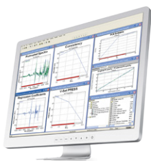
NIRCal® Software Développement de l'étalonnage chimiométrique