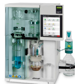
KjelMaster K-375 Distillation et titration de la vapeur