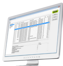
NIRAnywhere Software Solution réseau