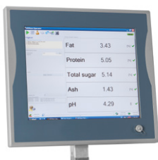
Monitor IP65 Écran tactile étanche