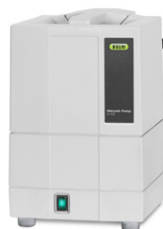
Bomba de vacío V-100 La fuente de vacío al mejor precio