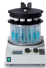
Multivapor™ P-6 / P-12 Evaporación eficaz para muestras múltiples