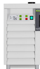
Refrigerador recircula Chiller F-100 / F-105 La solución sencilla para la refrigeración