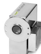
NIR-Online® Control de calidad de producción en tiempo real