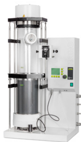
Nano Secador por aspersión B-90 HP Secador por pulverización para muestras y partículas pequeñas