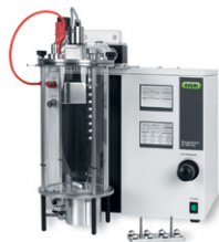
Encapsulador B-390 / B-395 Pro Producción cuidada de perlas y cápsulas