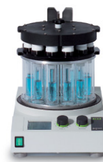
Multivapor™ P-6 / P-12 Effiziente parallele Verdampfung mehrerer Proben