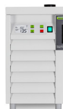
Umlaufkühler F-100 / F-105 Die einfache Art der Kühlung