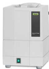
Vakuumpumpe V-100 Die wirtschaftliche Vakuumerzeugung