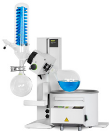
Rotavapor® R-100 Wirtschaftliche Verdampfung