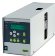
UV-Vis Detector C-640 Спектрофотометри- ческий детектор