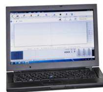
SepacoreControl Software Программное обеспе- чение для комплекс- ного управления