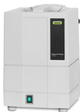
Vacuum Pump V-100 La fonte di vuoto più conveniente