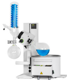
Rotavapor® R-100 Evaporazione facile e conveniente