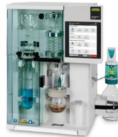
KjelMaster K-375 증기 증류 및 적정