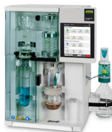
KjelMaster K-375 Destilação por vapor e titulação