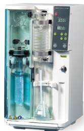
Distillation Units К-350 / К-355 Паровая дистилляция