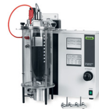
Encapsulator B-395 Pro

Spray Dryer untuk sampel dan partikel kecil