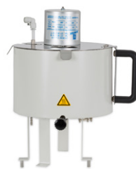
Spray Chilling ทำความร้อนตัวอย่างและพ่นฝอยในหลอดกลั่นเย็น

เครื่องทำแห้งแบบพ่นฝอยสำหรับตัวอย่างขนาดเล็กและอนุภาค