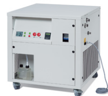
Inert Loop B-295

ตัวทำละลายอินทรีย์สำหรับการทำแห้งแบบพ่นฝอย