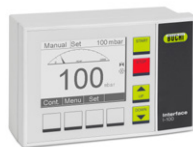
Interface I-100 Wirtschaftliche Vakuumregelung