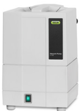
Vacuum Pump V-100 Die wirtschaftliche Vakuumerzeugung