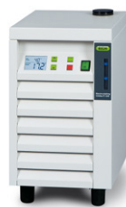
Recirculating Chiller F-100 / F-105 Die einfache Art der Kühlung