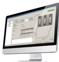
Melting Point Monitor Software データ管理用ソフトウェア