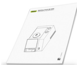
IQ / OQ for M-565 用品質管理手順