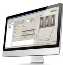
Melting Point Monitor Software 数据管理软件