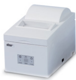
Star Printer 串行打印机