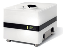
NIRMasteR™ IP54 提供具有防护功能的 FT-NIR 光谱仪