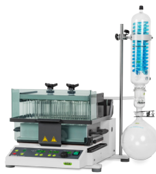
Syncore® Polyvap 多样品并行蒸发