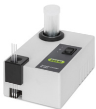
Sample Loader M-569 高效的毛细管填充