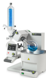
Rotavapor® R-300 Evaporação rotativa prática e eficiente