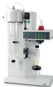
Mini Spray Dryer B-290 Líder mundial de secadores por atomização de laboratório