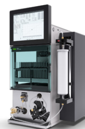
Pure Chromatography Systems Adequado às suas necessidades e meio ambiente