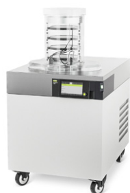
Lyovapor™ L-300 Primeiro Liofilizador de laboratório para sublimação contínua