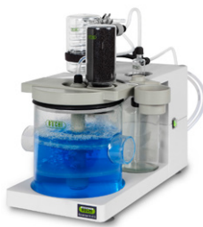
Scrubber K-415 Neutralización