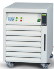
Recirculating Chiller F-108 La solución eficaz para la refrigeración