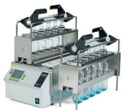
SpeedDigester K-439 / K-425 / K-436 Digestión IR