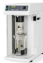
Mixer B-400 Molido y homogeneización