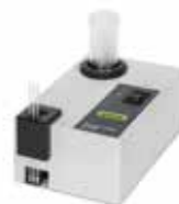
サンプルローダー