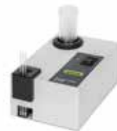
サンプルローダー