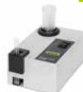
サンプルローダー