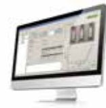
融点モニターソフトウェア