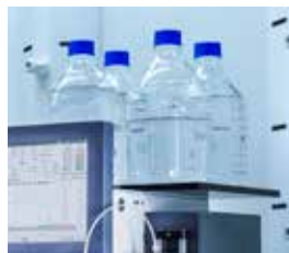
溶媒容器台 4L × 4本 品番:11069285-C