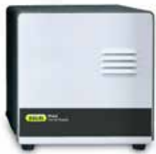
ドライエア・サプライユニット 品番:11069026-C