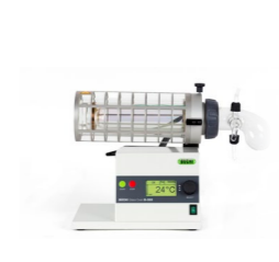
B-585 Drying (อุปกรณ์ทำแห้ง)