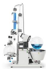
R-220 Pro / R-250 Pro