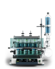
SyncorePlus (เครื่องระเหยสารแบบหลายตัวอย่างพร้อมกัน)