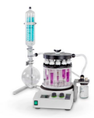
Multivapor™ (เครื่องระเหยสารแบบหลายตัวอย่างพร้อมกัน)