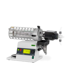
B-585 Kugelrohr (อุปกรณ์กลั่น)