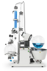
R-220 Pro / R-250 Pro